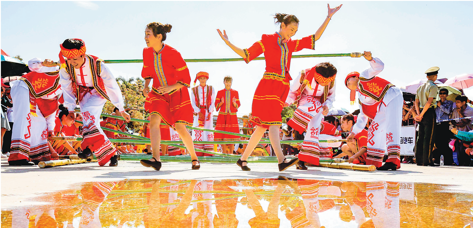
琼中万人齐跳竹竿舞共庆“三月三”。

近年来，得益于得天独厚的气候条件、区位优势，积极引进品牌酒店、景区景点、旅游配套设施等项目落地，精准发力促旅游产业形成势，推动湾区联动发展旅游综合体，逐渐成为国内高端度假酒店最集中的区域之一，不断提升旅游产品质量及服务水平，逐步形成国际性度假“俱乐部”，有力引领着国内休闲度假产业升级转型。