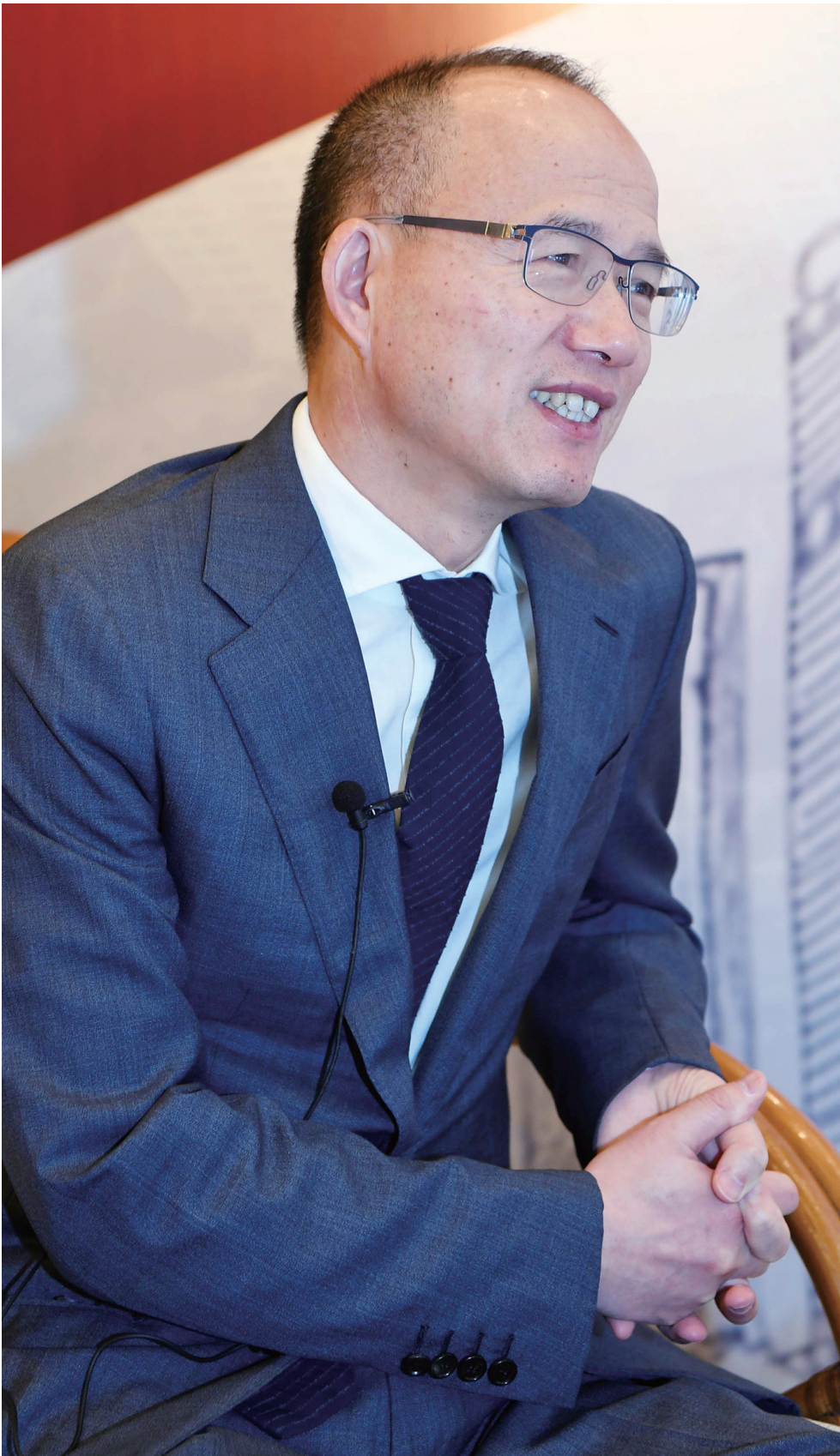
复星国际董事长郭广昌。

■ 中国改革开放40年最大的改变，就是让一批贫穷家庭的小孩受到教育，比如我自己，一路考试，跳出农门。其次是市场经济让一部分人用商业的方式使自己生活变得更美好，也用商业的方式，让社会更美好。