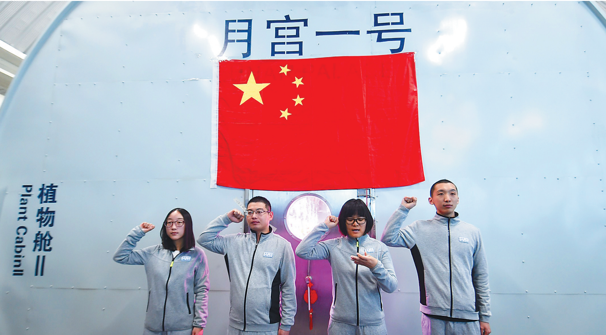
1月26日,准备入舱换班的一组志愿者入舱前宣誓。 当日,“月宫365”实验换班仪式在北京航空航天大学“月宫一号”实验室举行,4名大学生自去年7月9日换班入舱已在这个密闭空间连续驻留200天,打破了由俄罗斯科研人员创造的在生物再生生命保障系统中连续驻留180天的世界纪录。 “月宫一号”所使用的生物再生生命保障技术,是实现人类长期地外自治生存的关键。“月宫365”实验于2017年5月10日开始,将于今年5月10日结束。