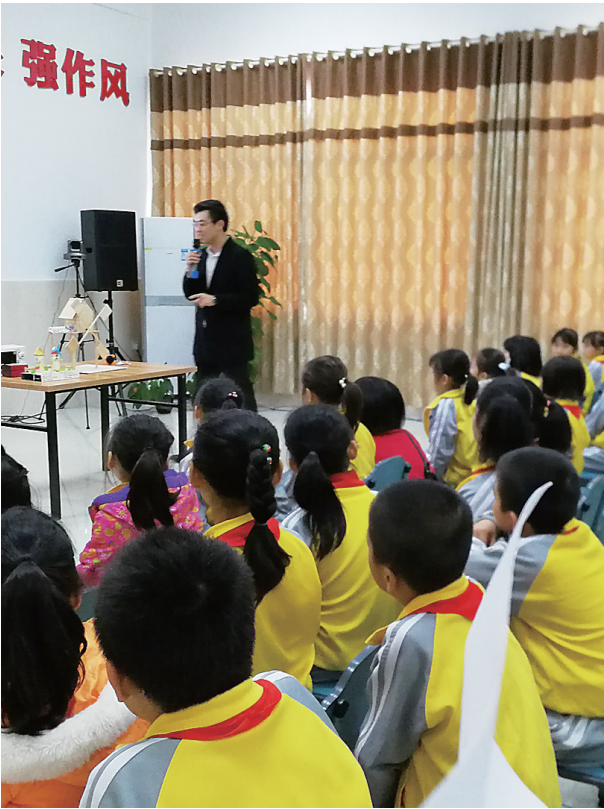
科学课能有效激发孩子的想象力和创造力。