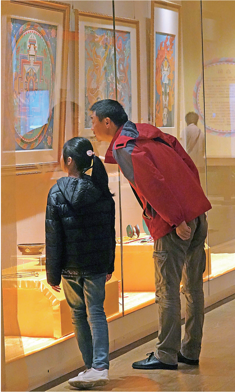
寒假到来,一名孩子在其家长陪同下到海南省博物馆参观文物展。

一些亲子合作的生动有趣的“家庭作业”,让严肃的寒假作业与活泼的“家庭作业”相辅相成,引导孩子合理安排和管理寒假的时间。这个过程可以让孩子学习如何做设计和安排进行时间管理,如何兼顾规定作业与自选作业。这其实是非常重要的生涯规划功课。这些技能可以迁移到其他的学习领域,帮助孩子养成良好的学习和生活习惯大有裨益。 其次,和孩子一起执行计划完成“家庭作业”。个人建议每个家庭根据自己的资源优势来设计和安排家庭作业的内容和形式。比如,带孩子认祖归宗,了解家族历史与文化,增进其对家族的认同感、使命感与责任感;让孩子感受年味十足的春节仪式,学习传统文化,体味春节礼仪的意义;带孩子了解故乡的风土人文,走亲访友听故事,培养亲近故土热爱家乡的情感;让孩子参与家务活动,感受家庭生活的烟火气息,家人共处的和谐温暖,从中学习如何过好家庭生活,如何与不同辈份的亲人相处等。 寒假里的“家庭作业”,要充分利用家庭、家族、故乡和职业的资源优势,多安排一些家人共处的时间和共同参与的活动,多一些家庭的仪式感,多一点亲情的温暖和生活的趣味,多一些亲子互动与亲情联接。这样的生活常识、体验与经验唯有家庭能教给孩子。美国哲学家、教育家杜威认为,教育即生活,最好的教育就是“从生活中学习”“从经验中学习”。从这个意义上说,“家庭作业”在这方面是大有作为的。 家长们,请珍惜假期难得的亲子共处时光,让丰富多彩的家庭作业”给孩子的寒假添一缕亮色与暖意! 祝您和孩子共享美好的寒假! 惠君 (作者系海师附中心心理教育中心主任、心理健康教育特级教师)