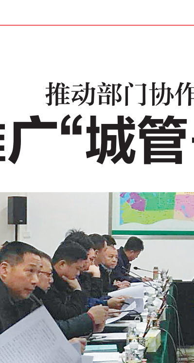
1月30日上午，海口城市管理委员会系统在秀英区环卫PPP公司交流“城管+环卫”联动执法模式。

整改： 将基层党建列入县委重要议事日程，作为“一把手”工程组织推动，着力提升基层党建整体水平。严抓基层党组织党内生活，对17个未按时换届的基层党组织进行换届或撤销，完成全县4个直属国有企业党组织换届工作，“两新”党组织组织覆盖率73%。大力开展党费补缴专项整治，全县共补缴党费26.37万元。建立县级领导干部和机关单位“一对一”党建工作帮扶联系点制度，强化党建巡查监督，规范促进“三会一课”制度落实。召开全县基层党建推进会，全面推动“六星党支部”建设，全面提高党支部规范化科学化水平。投入3874万元大幅度提高村级组织工作经费、在职村（社区）“两委”干部补贴、村民小组补贴等，落实服务群众专项经费，安排2600万元支持26个贫困村发展集体经济，充分发挥党支部引领作用。