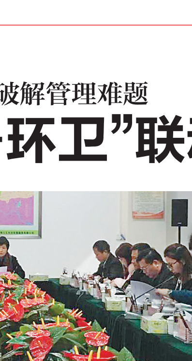
1月30日上午，海口城市管理委员会系统在秀英区环卫PPP公司交流“城管+环卫”联动执法模式。

整改： 县委从严落实党风廉政建设责任制考核机制，由县委常委带队对82家单位推进党风廉政建设工作进行考核，并将考核结果作为调整、选拔干部的重要参考；立足抓早抓小，严格执行谈话提醒月报制度，有效规范和督促各级领导干部履行“一岗双责”职责。2017年共开展谈话242人次，其中提醒谈话203人次，诫勉谈话39人次；开展扶贫领域专项督查2轮，排查出违纪违规问题线索35个，给予党纪政纪处分17人；开展中央环保督察“回头看”工作，问责19人，其中通报批评10人，诫勉谈话9人；坚持政治巡察定位，开展4轮巡察，深入19个单位进行巡察，前3轮共发现问题338个，发现问题线索44件，涉及56人，督促被巡察党组织整改问题126个，有效发挥巡察利剑作用。