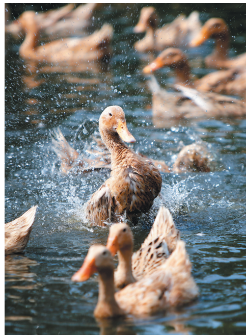
儋州跑海鸭所产的跑海鸭蛋是九大农产品之一。