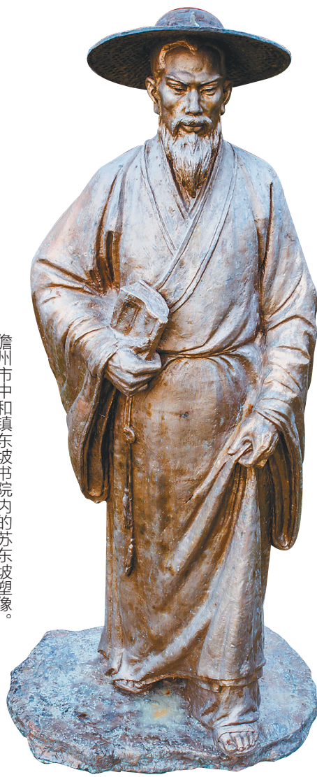
儋州市中和镇东坡书院内的苏东坡塑像。

2017年 全市生产总值达 288.04 亿元,同比增长 8.2% ,较1990年增长 17.81 倍