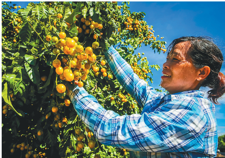
儋州市大成镇南吉村村民在采摘黄皮。