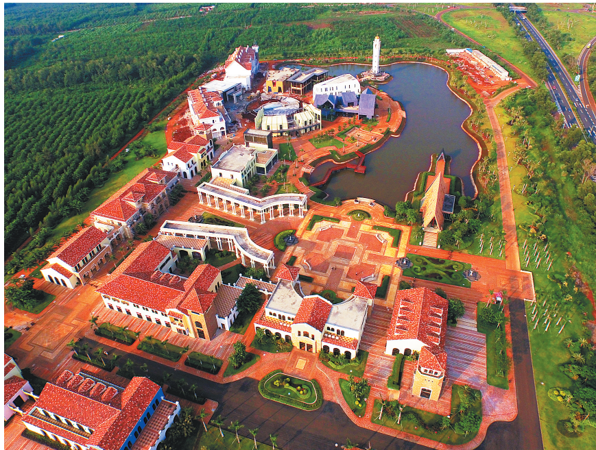
儋州市光村雪茄风情小镇实现产业融合发展。