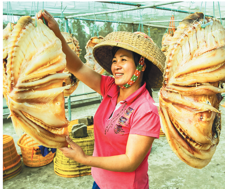
儋州红鱼寄托“鸿(红)运当头,年年有余(鱼)”的美好愿望。