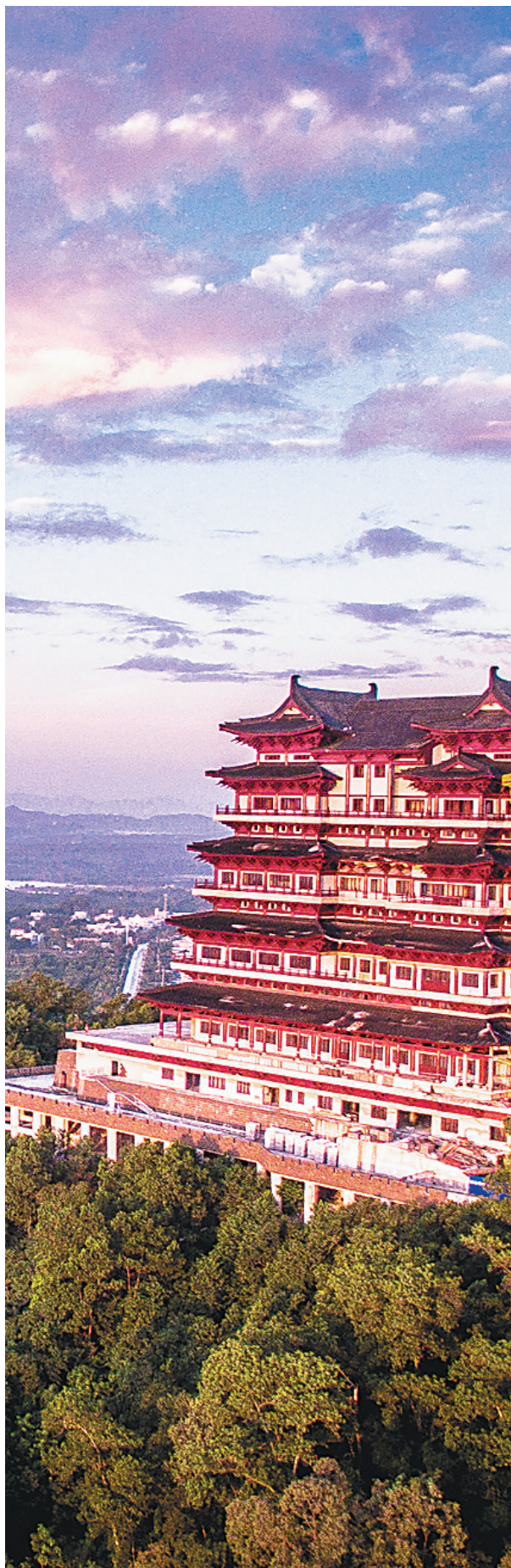
儋州地标性景观观阳楼。