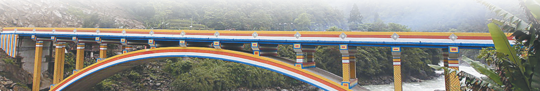
这是横跨独龙江的云南省贡山独龙族怒族自治县的斯拉洛大桥。