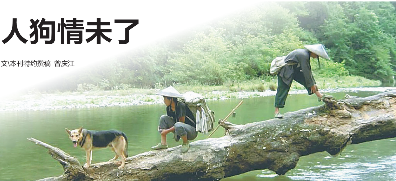
《那山那人那狗》剧照

影视剧中闪耀的明星并非全部都是人类。动物王国中也有许多聪明伶俐、勇敢无畏或滑稽可笑的大明星。狗作为人类忠实的朋友,是许多影视作品的表现对象。很多影视作品,或单纯表现狗的世界以折射人类生活,或从狗与人的关系中彰显狗的本性,或人狗同台共同演绎酣畅淋漓的娱乐大餐,或借人与狗的关系深入反思人性问题……这些作品立体地彰显了人与狗的关系,谱写了一曲又一曲人狗未了情。