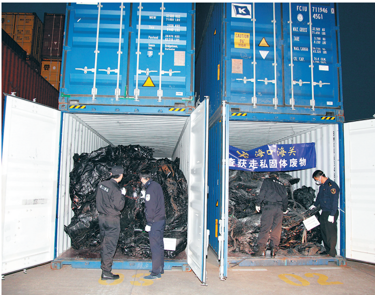
海口海关开展打击洋垃圾走私“蓝天”行动，最大限度将有毒有害物品阻截在国门之外。

固体废物案件，有效封堵废物走私入境通道。强化知识产权海关保护，推荐4家企业入选海关“龙腾行动”重点保护企业名录，首次联合海南省“双打办”等部门举办“海南省外商投资企业知识产权保护行动联合宣讲会”，与省知识产权局、版权局签订执法协作备忘录，年内成功查获关区首宗货运渠道出口货物涉嫌侵犯知识产权情事，大力营造良好的营商环境。 全方位打击走私维护贸易秩序。深入落实全国重点地区打击走私工作座谈会精神和全省“禁毒三年大会战”部署，全力开展“国门利剑2017”、全省禁毒三年大会战“秋冬攻势”等专项行动。年内先后成功侦办“HK1701”特大走私宝石原石案件、“4·26”特大骗取出口退税、骗取地方政府补贴走私案、枪毒走私团伙案等大要案，提前超额完成省“秋冬攻势”行动任务目标。全年各项主要业务指标均创历史新高。