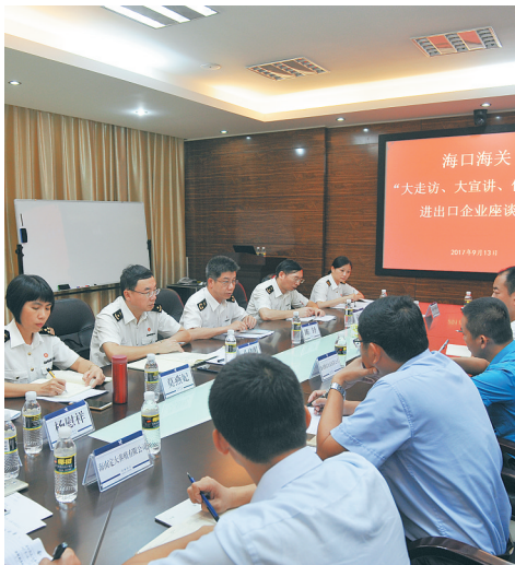
海口海关在全省范围内开展“大走访、大宣讲、优服务”专项行动。

持续巩固拓展落实中央八项规定精神成果，深入贯彻习近平总书记关于进一步纠正“四风”、加强作风建设的重要批示精神，做到信念过硬、政治过硬、责任过硬、能力过硬、作风过硬，着力锻造忠诚干净担当的干部队伍，以过硬的作风扎实落实中央和总署党组、省委省政府各项部署。