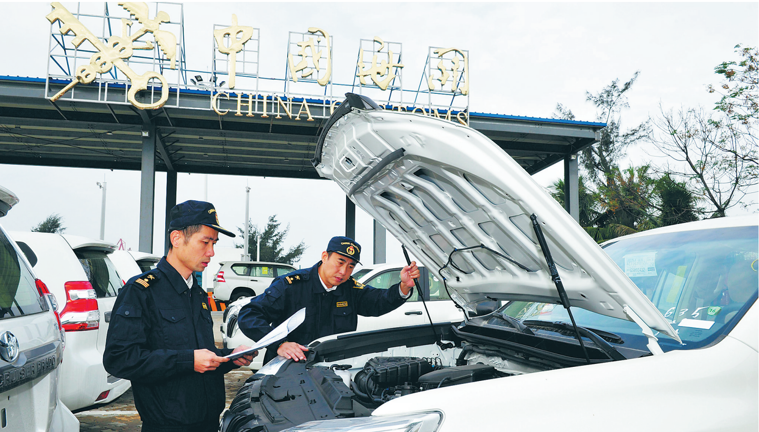
海口海关支持汽车进出口业务加快发展 服务海南汽车龙头企业打造「万台整车出口菲律宾计划」，推动海口港整车进口首次突破1000辆大关。

2017年以来，海口海关深入学习宣传贯彻党的十九大精神，在海关总署和海南省委、省政府正确领导下，坚持将海关工作放在服务国家开放战略和海南经济社会发展大局中推动，紧紧围绕支持我省发挥“生态立省、经济特区、国际旅游岛”三大优势，对照省第七次党代会任务目标，坚持强化监管、优化服务、深化改革，全面履行好海关把关服务职责，全力以赴助力海南构建开放型经济新体制。