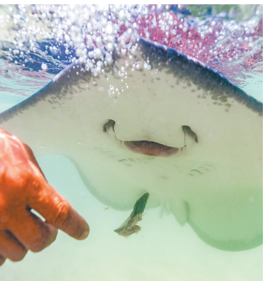
2月4日，陵水分界洲岛旅游区，景区工作人员在喂食一只鲎鱼。

本报椰林2月6日电（记者林晓君 通讯员董国强）记者日前了解到，以海洋旅游项目为主打产品的陵水黎族自治县分界洲岛旅游区再添鲎鱼观赏项目，并将于近日向游客开放。届时，游客可以近距离观赏10多只鲎鱼在浅水里游动、捕食，并可与鲎鱼互动。 据了解，鲎鱼又称魔鬼鱼、老板鱼，属常见鱼类，广泛分布于热带和温带各近海岸海区。分界洲岛鲎鱼观赏互动区紧邻景区码头，位于纯自然海域。鲎鱼在观赏区内自由游动、捕食。游客可以观赏到鲎鱼捕食、玩耍的情形，并可拿鱼块给鲎鱼喂食。该项目将丰富游客在景区的游玩内容，增加海洋旅游乐趣。 分界洲岛旅游区是中国首家海岛型国家5A级旅游景区。目前，景区内还有海洋剧场、海底观光潜艇、“海上飞龙”、潜水、珊瑚展区、海捞艇展区等海洋特色旅游项目，其中海洋剧场有海豚、海狮互动表演，是游客了解海洋生物的一个好去处。