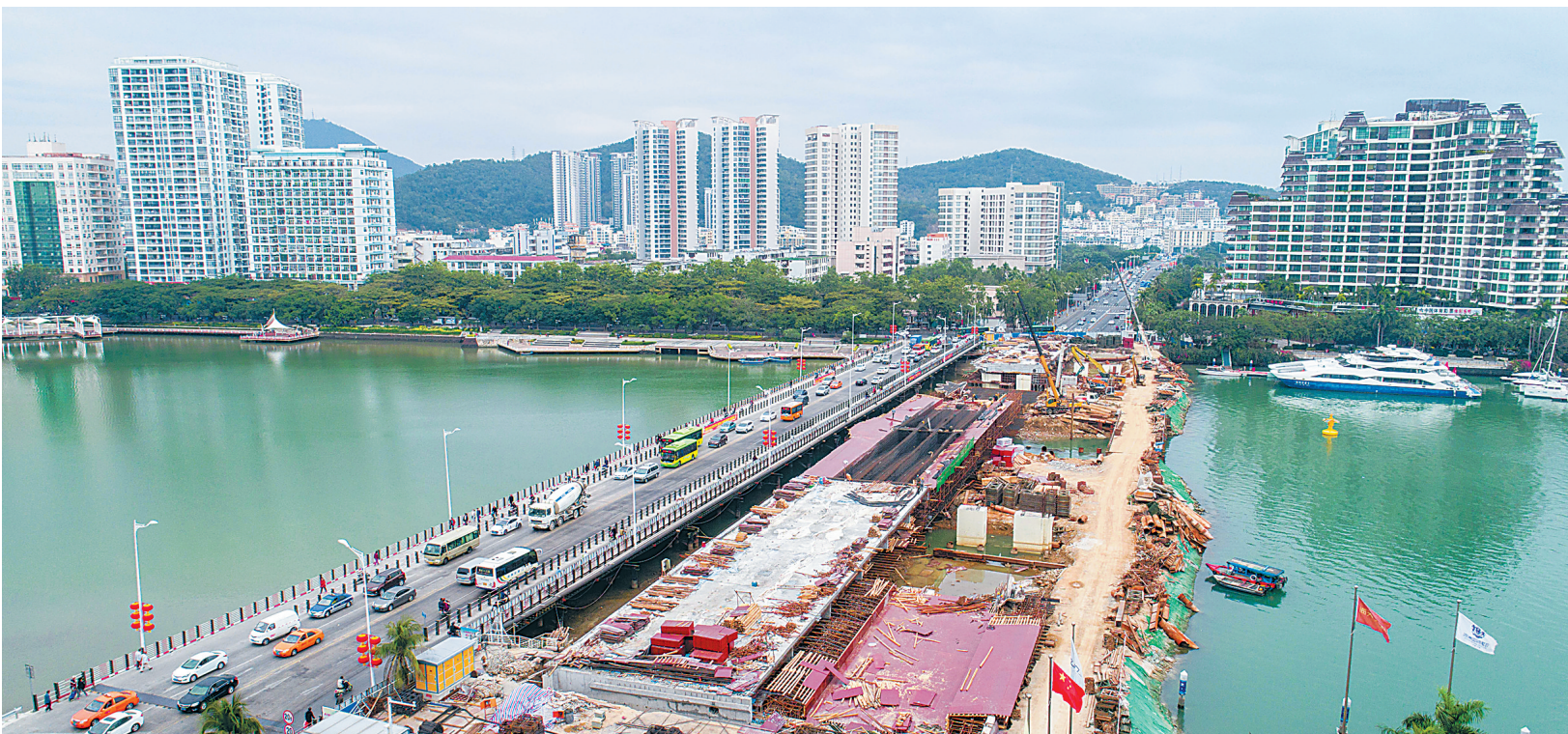
新三亚大桥初露真容 预计今年上半年功能性通车

安全设施、增设道路照明系统、监控系统及沿线服务设施等,项目于2016年10月开工,合同工期17个月,原计划于2018年3月完工。 海口交警提醒广大车主,需从G98海口绕城高速西向东方向前往海口市市区、美兰机场、G98东线高速的车辆,目前已可直接由海口绕城高速前往,不必再绕行。