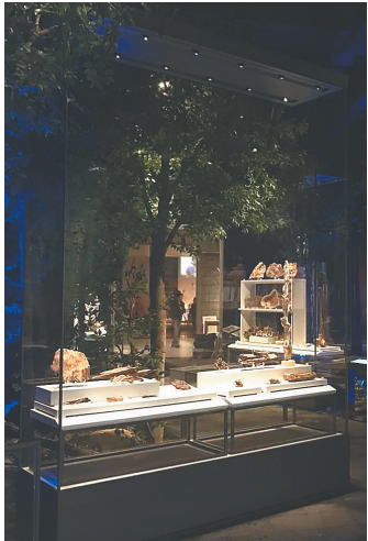
《香中魁首——海南沉香陈列》展厅。

该展览分为三个部分。第一部分为“天涯奇香”，第二部分“香漫琼崖”，第三部分为“贸香为业”。