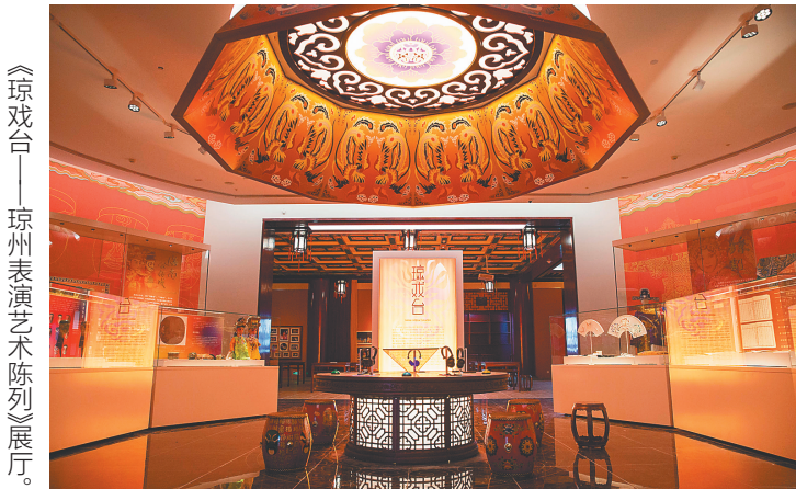
《琼戏台——琼州表演艺术陈列》展厅。