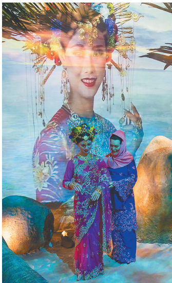
《琼崖村——海南少数民族非物质文化遗产陈列》展厅。