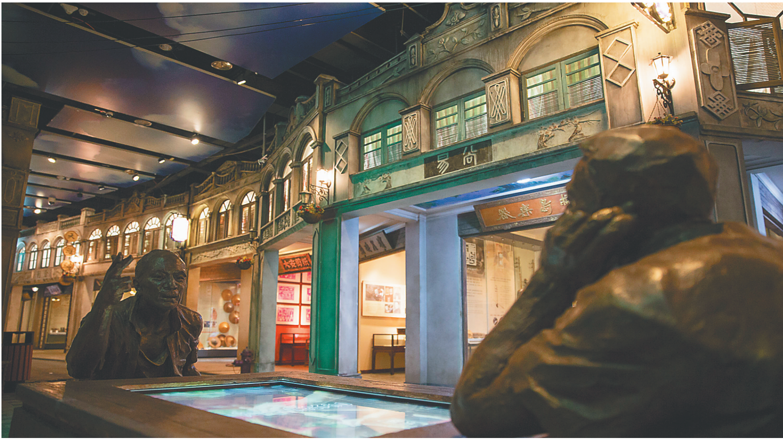
《琼工坊——海南传统手工艺陈列》展厅。

2008年11月15日海南省博物馆一期建成开馆，2012年底省博二期作为海南省“十二五”规划的重大文化项目之一开建，于2017年5月18日正式开馆，2018年2月8日一期提升改造完成并开放，至此，海南省博物馆以崭新面貌迎来全面开馆。现馆区总面积达44500平方米，展厅面积约12000平方米，地下库区约9300平方米，馆藏文物约25000件(套)。