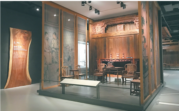
《木中皇后——海南黄花梨陈列》展厅。

南溟之浩瀚，舟船往来。海南岛西部北部湾近海渔民从事着海洋捕捞、海洋养殖、煮海晒盐等多种多样的生产活动，他们接受着海洋的馈赠，形成了特色鲜明的渔家生活