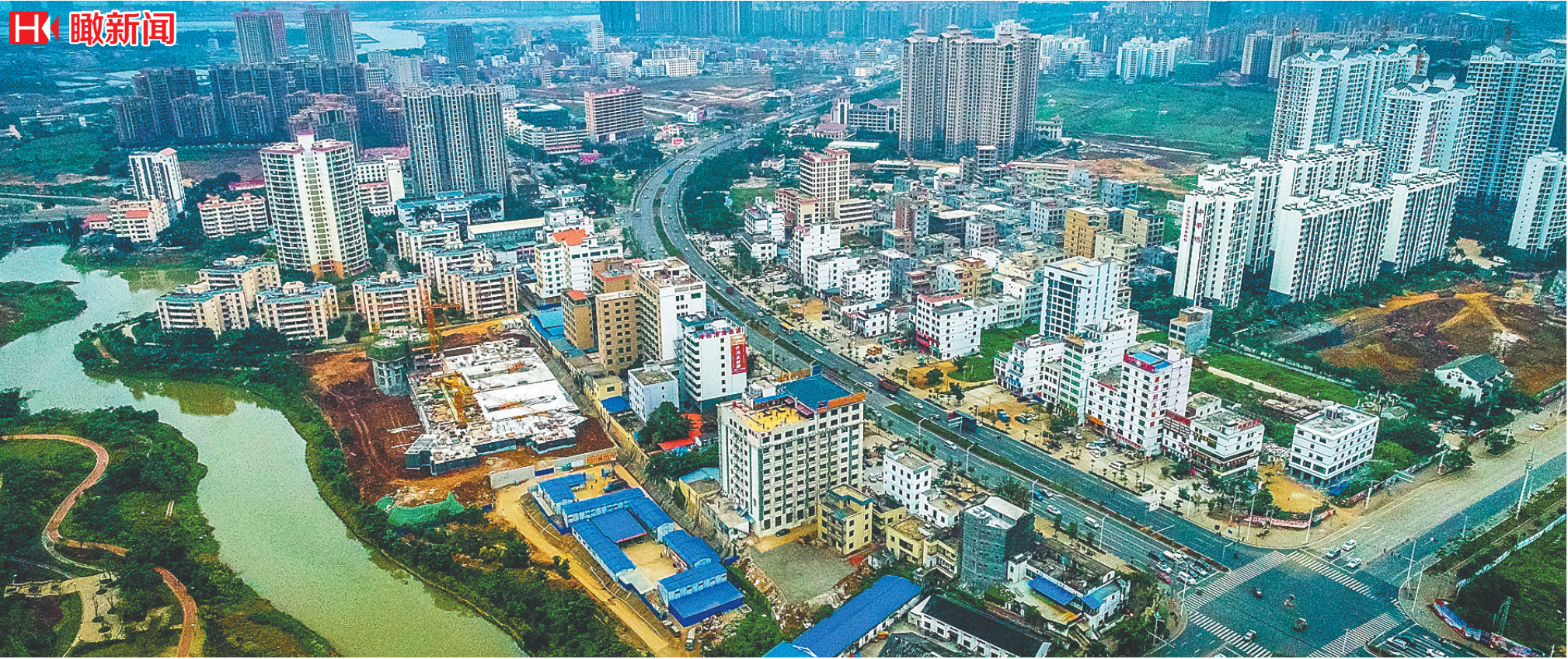
2月8日，航拍位于澄迈县的海南老城经济开发区。截至2017年底，海南老城经济开发区累计入驻企业3339家。

使每台机器每年可降低能耗660万千瓦时；华能海口电厂在燃煤发电灰渣的堆放地上建起了光伏电站，日最大发电量超过14万千瓦时……曾海燕告诉记者，“2018年，我们要瞄准前沿科技、新兴产业和‘互联网+’项目，重点引进能够带来中上游产业链的龙头企业项目和培育重大税源的项目，同时加快筹备，将海南生态软件园‘极简审批’试点经验推广到老城经济开发区内的工业项目和政府投资项目。”2018年，老城经济开发区正以愈发稳健的步伐，迈向属于它的又一个春天。（本报金江2月8日电）