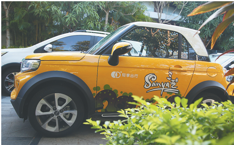
近期,绿色智能共享出行平台——“轻享出行”进入三亚市场。

1月18日,北汽新能源旗下绿色智能共享出行平台“轻享出行”在三亚举行“生而共享,自在出行——轻享生态战略联盟成立暨三亚开城仪式”,此举标志着“轻享出行”正式进驻三亚市场。 “轻享出行”首批在三亚投入300台高品质运营车辆,并将陆续增加至800台;首批分两期开通48个运营服务网点,全面覆盖三亚的高端商业、酒店、社区、旅游景区、高铁、机场等地,为人们旅游出行带来高效便捷的服务体验;提供分时租赁、夜租、日租、周末租、周租等多元化产品模式,满足不同人群的差异化出行需求。未来,该平台将立足三亚,全面布局海南,计划投入5000台新能源车用于运营服务。 “共享一部车,轻享一座城”,“轻享出行”进入三亚市场,根据当地旅游城市的特点,建立吃、住、行、购、乐的旅游矩阵,与游客集中的酒店、社区、商业、景区、机场、高铁签订战略合作,让游客一到目的地就有车辆供给,一出酒店就能看到“轻享出行”的网点,满足用户随时随地的用车需求。