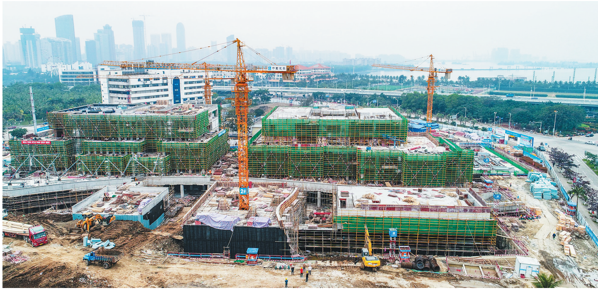
2月9日,海口市市民游客中心项目施工现场一片繁忙。