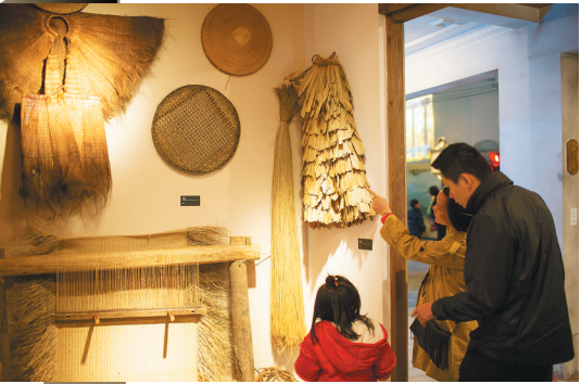
“琼工坊”内,观众在欣赏藤编技艺。

“琼戏台”里琼音袅袅,文韵芬芳,“今则礼义之俗日新矣,弦诵之声相闻矣”的繁荣景象在琼剧、儋州调声等诸多“琼音”之中灵动浮现。