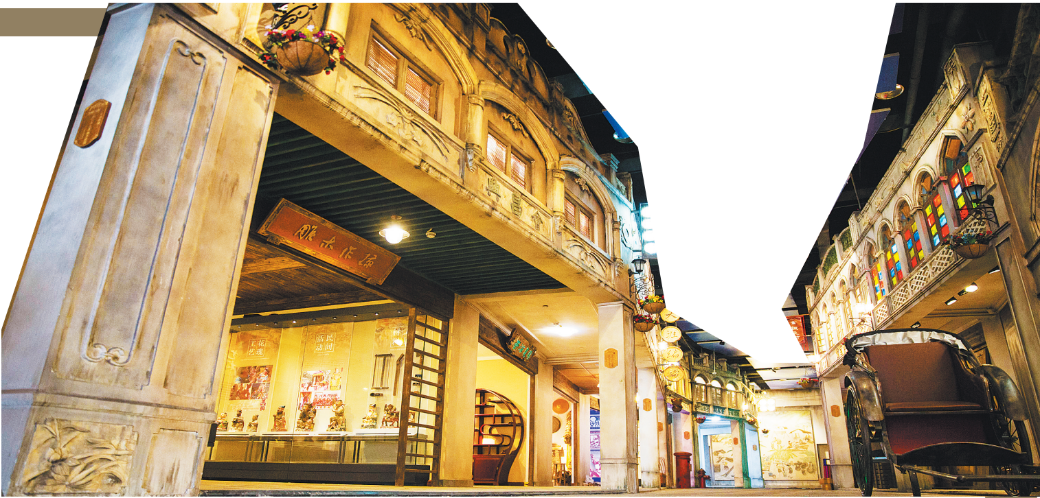
省博物馆内的“琼肴街”——海南饮食文化陈列展厅。

从2008年落成开馆,到如今升级扩容,10年间,省博物馆以丰富、系统的展览内容,令人耳目一新的展陈手段等,讲述着海南故事,也推动着我省文博事业的蓬勃发展。