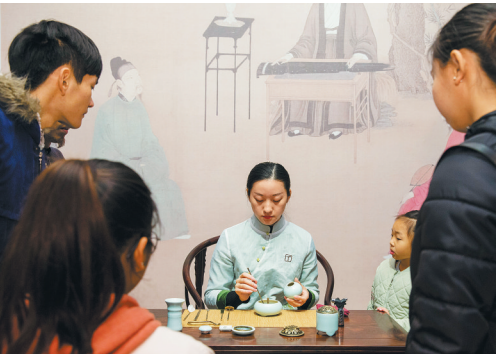
沉香陈列展区香道表演。