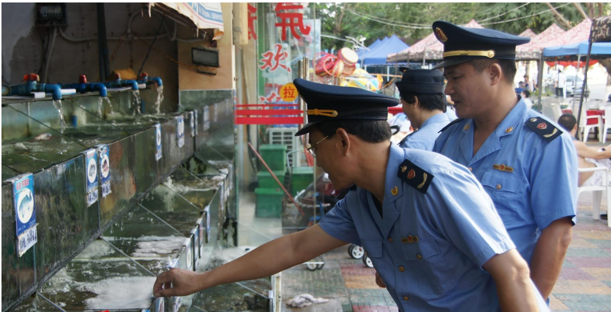
工商执法人员正在检查海鲜排档。

当事人海口椰乡缘食品有限公司委托海南鹰航空饮品有限公司生产的椰众、椰韶、椰旺等7家品牌椰汁的包装装潢仿冒椰树集团有限公司的“椰树”牌椰