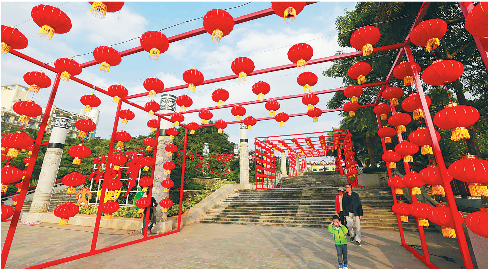
琼中张灯结彩迎新春。

活动时间:2月14日至3月2日(农历腊月初二十九至正月十五) 活动地点:琼中县城“三月三”广场