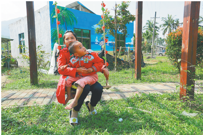
琼中黎族苗族自治县和平镇堑对村万道村民小组的儿童在荡秋千。

春节即将来临。近日,琼中黎族苗族自治县委宣传部、财政局、文联等部门携手组织书法协会开展“情系贫困户 送福到农家”活动,为群众写春联,活动当天共为村民现场书写了600余幅春联。