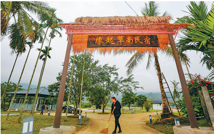
客入。草南民宿」的管理人员在打扫卫生以迎接近日,在琼中县红毛镇草南村,「缘起

为确保琼中春节假日旅游市场秩序安全稳定,琼中县各职能部门严阵待发,加大旅游市场的管治力度,强化环境卫生大整治和提高旅游服务质量,确保省内外游客在琼中度过一个安全、欢乐、祥和的新春假期。