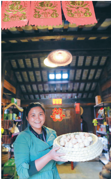
琼中鸭坡村农户备好年货迎新春。

近年来，琼中按照“打绿色牌、走特色路”总体发展思路和“一心一园一带八区”总体发展布局，“五片八区十线”旅游发展格局提档升级，百花岭风景名胜区服务配套功能更加完善，“什寒模式”在便文、仕阶等村寨推广，堑对、合老村喜迎游客。琼中入选海南首批创建国家全域旅游示范区。目前，琼中已打造富美乡村179个，形成一批休闲旅游、乡村旅游、文化旅游、生态旅游、亲子旅游等旅游村寨。