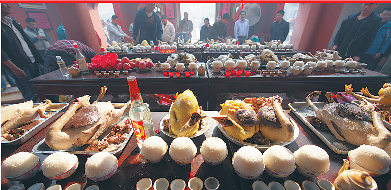
鸡、鸭、鹅和饭团是海南人常用的祭祖食物。