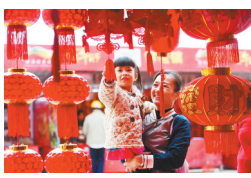
琼海市民带着孩子选购红灯笼。

对于众多文昌人来说，春节总是与华侨有着密切的联系。那些早年漂洋过海去番讨生活的华侨们，无论多么辛苦，都会在生活安定下来之后回家过年。也许是由于漂泊在国外，华侨们对家乡的习俗尤为重视。例如，文昌人的“送灯”习俗：每年，村庄里有男丁的人家都会轮流做“灯头”，在正月初五这天，家里的男丁就提上用纸糊的灯笼，将灯笼送入土地公庙，悬挂直至正月十五。“只要轮到哪家华侨家里做‘灯头’了，就一定会回来过年的，并且一定会做得热热闹闹。”林先岱说。