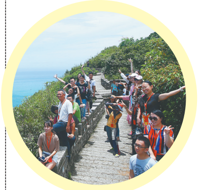
游客在文昌铜鼓岭景区一睹月亮湾美景和龙楼航天发射场风采。