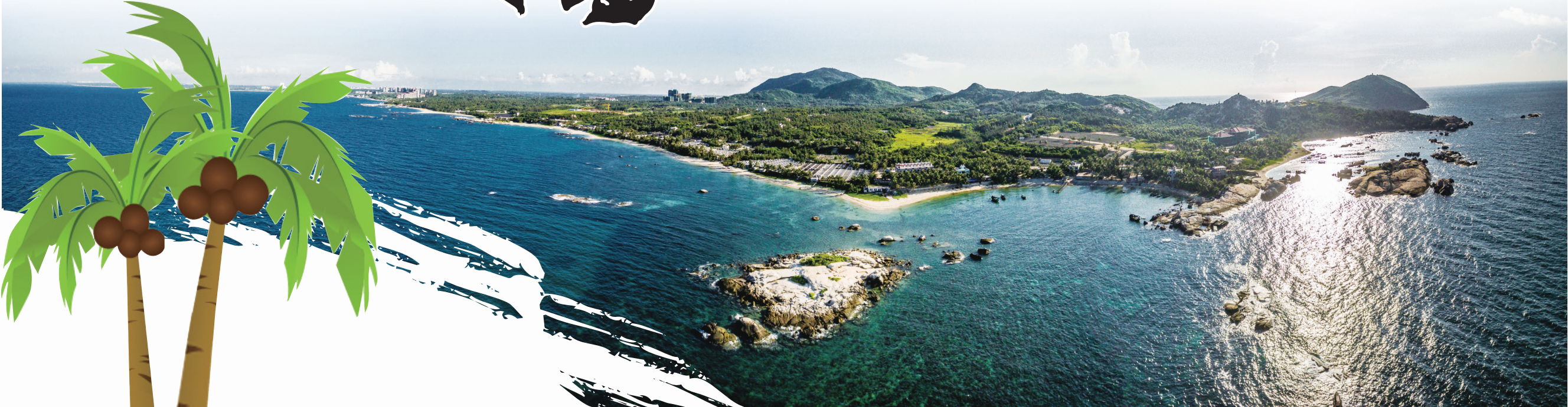
文昌龙楼镇石头公园是个航天旅游景点,旅客在此可观看火箭发射,还可欣赏奇石与海滩风光。