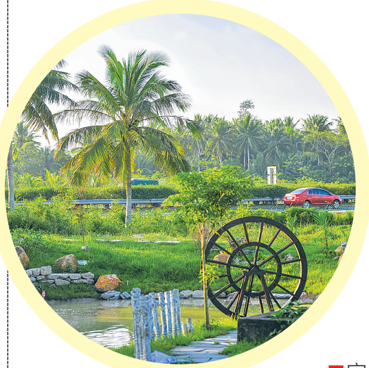
经过美丽乡村建设,潭牛镇大庙村美丽绽放。

“‘两桥一路’(铺前大桥、清澜大桥、滨海旅游公路)工程不仅改善了交通格局,助推文昌加快融入海澄文一体化,未来城乡面貌还将发生翻天覆地的变化。”文昌市委书记钟鸣明说,30年经济社会的发展,为文昌打下了良好的基础。新时代新征程,对标中央和省委要求,接下来,文昌将聚焦十二大产业,继续深化供给侧结构性改革,“一方面要大力发展新兴产业,助推航天城建设;另一方面,将以美丽海南百镇千村工程为抓手,重振东郊椰林这张海南旅游老品牌,发力全域旅游”。