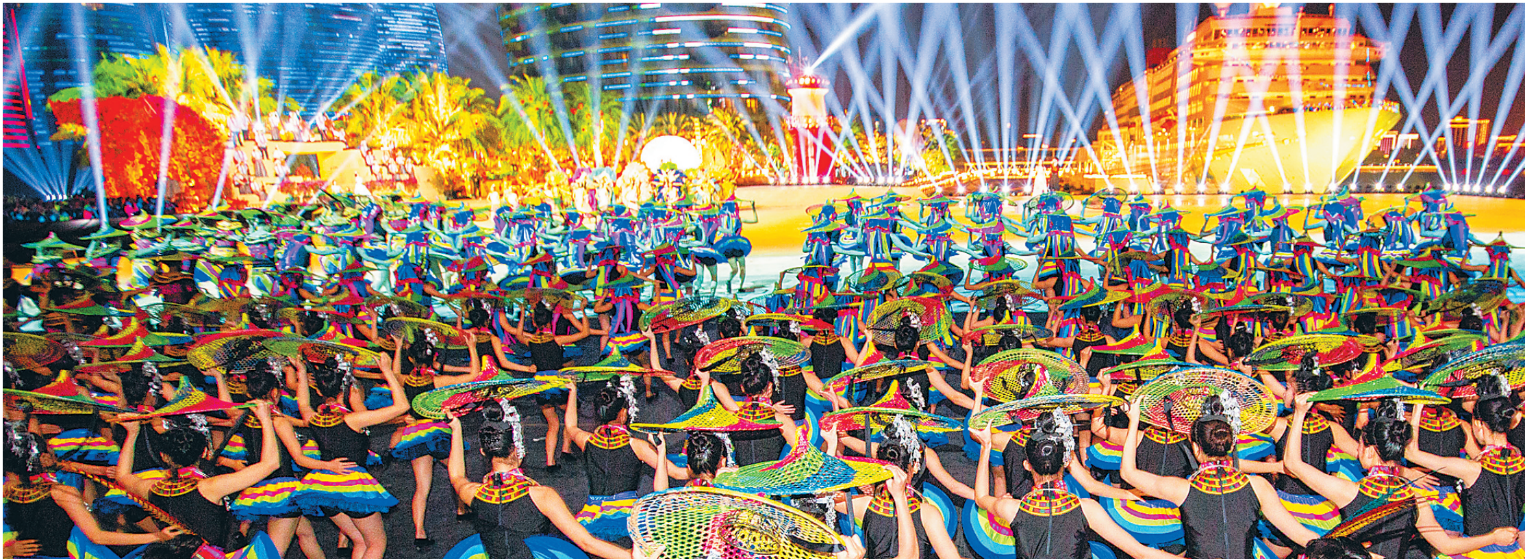
央视狗年春晚海南分会场，演员们准备上场表演竹竿舞。