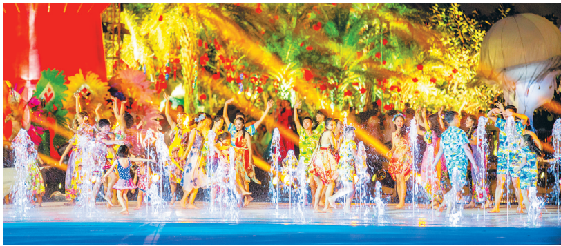
央视狗年春晚海南分会场沙滩戏水表演。

三亚崖城镇居民黎俊彤告诉记者:“春晚海南分会场拍摄的海面风景,我觉得就是在拍自己的家。整个春晚让我感受到了海南的建设者们为加快建设美丽