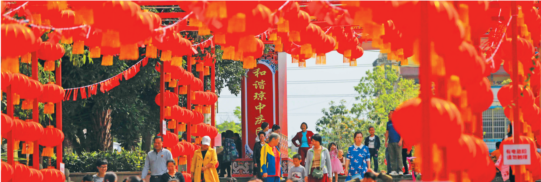
2月16日,琼中黎族苗族自治县迎春游园活动在三月三广场举行。