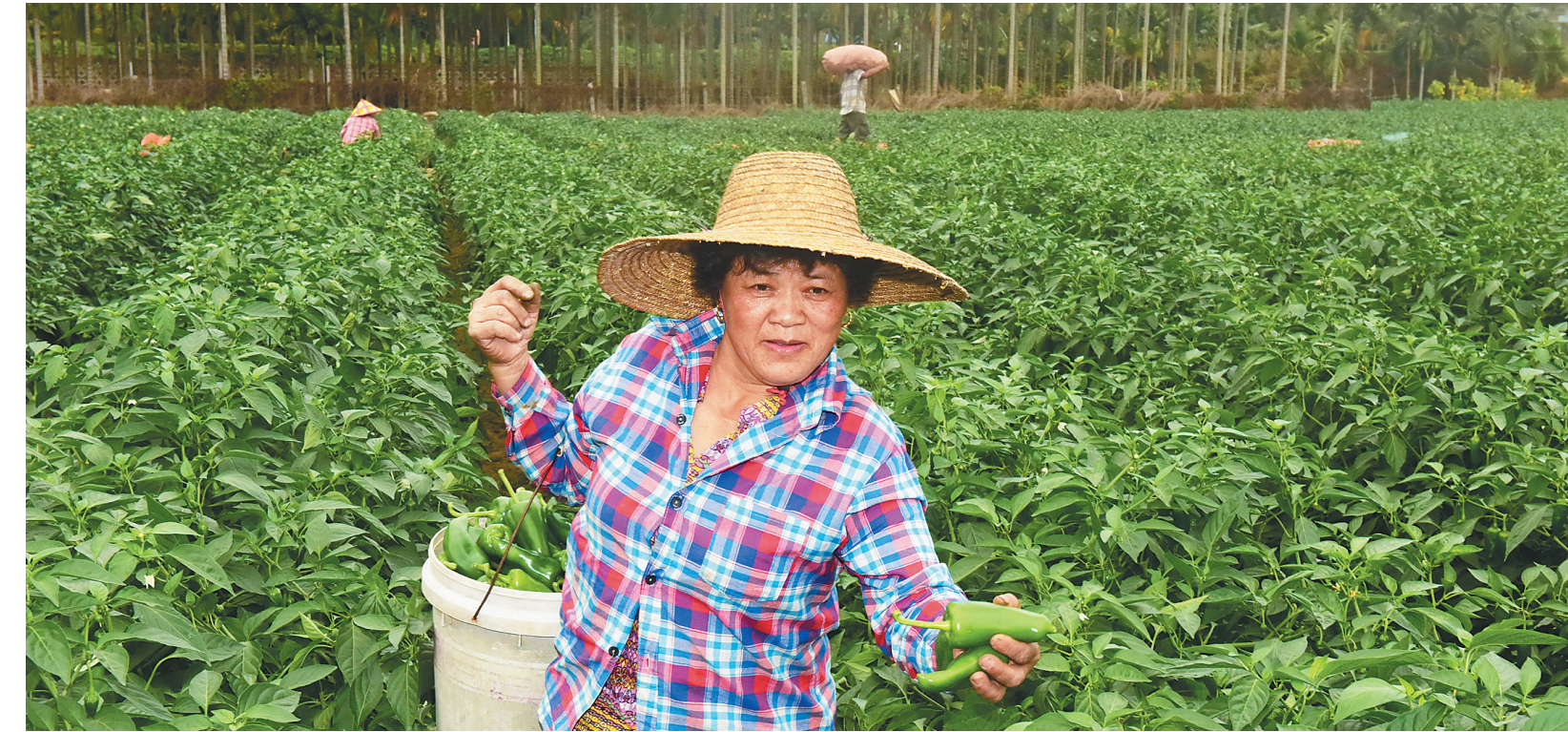
开春好年景 田园采摘忙

2月22日，琼海市嘉积镇的农民在田间采摘辣椒。新春以来，琼海市种植的反季节辣椒长势喜人，泡椒收购价格保持在每斤2元左右。目前农民正在加紧采摘辣椒，销往省内外市场。