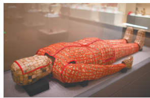
南越王汉墓“丝缕玉衣”。