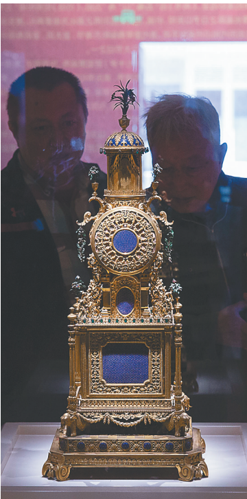
铜镀金转花变字水法钟。