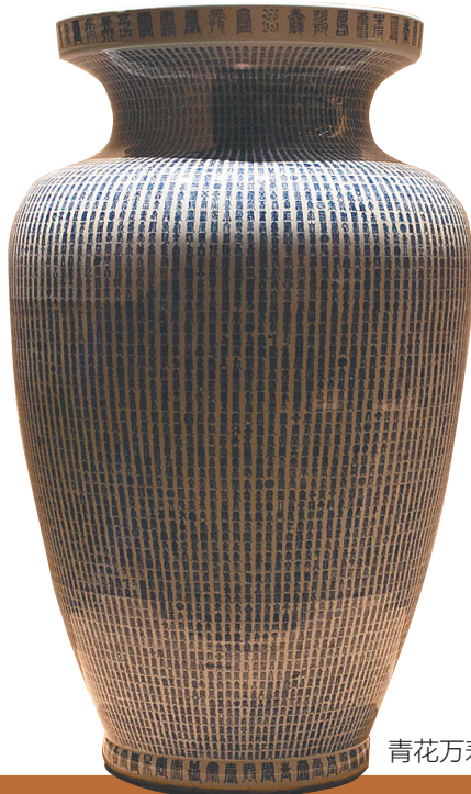
青花万寿字纹撇口大瓶。