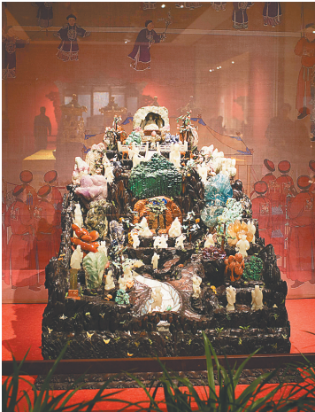
蓬莱仙境玉石仙台。