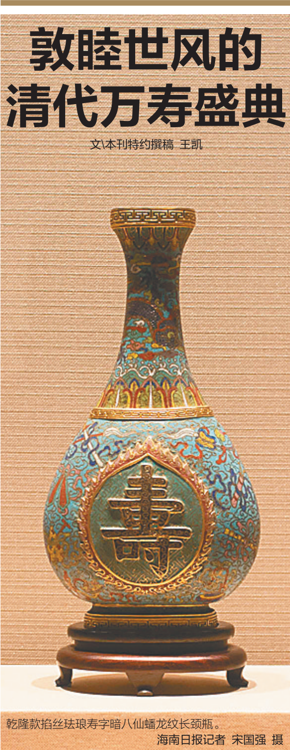
乾隆款掐丝珐琅寿字暗八仙蟠龙纹长颈瓶。

康熙六十一年(1722年)农历正月,康熙皇帝已经69岁,为了预庆自己70岁生日,他在乾清宫举办了第二次千叟宴,皇孙弘历