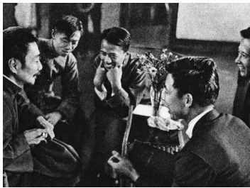
鲁迅(左一)与青年在交谈

文学大师鲁迅先生，自幼与元宵结缘，不管在日常生活当中，还是文学创作之上，都能从中体味出浓郁的节日味道。