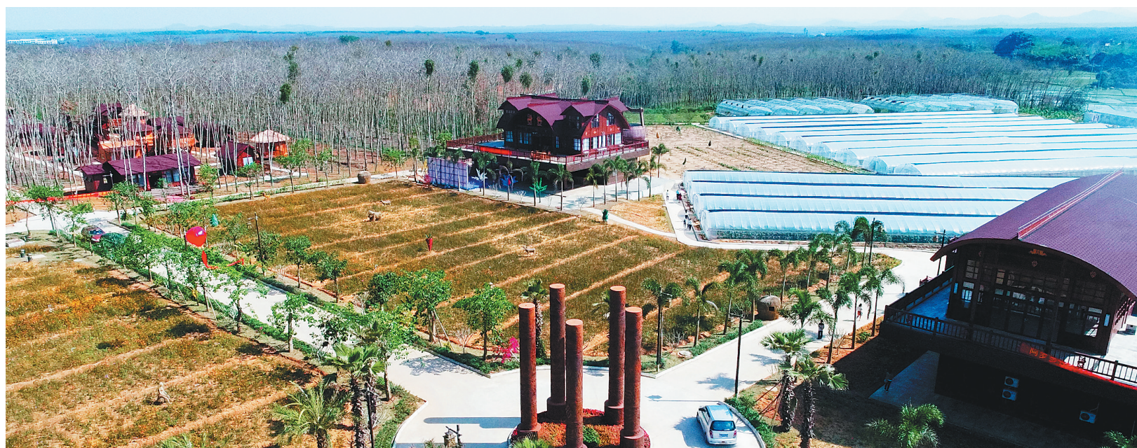
2月27日，白沙七坊镇阿罗多甘共享农庄建成对外开放。