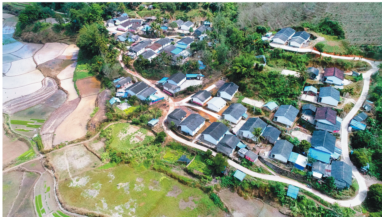
俯瞰白沙南开乡高峰村，村貌焕然一新。

此外，记者还获悉，白沙县委、县政府为进一步贯彻落实《中共中央、国务院关于全面深化新时代教师队伍建设改革的意见》，加大投入力度推动教育事业发展。今年白沙将投入约260万元面向社会招聘教师，旨在为教师队伍补充新鲜血液、提升教师队伍水平，促进教育均衡发展。