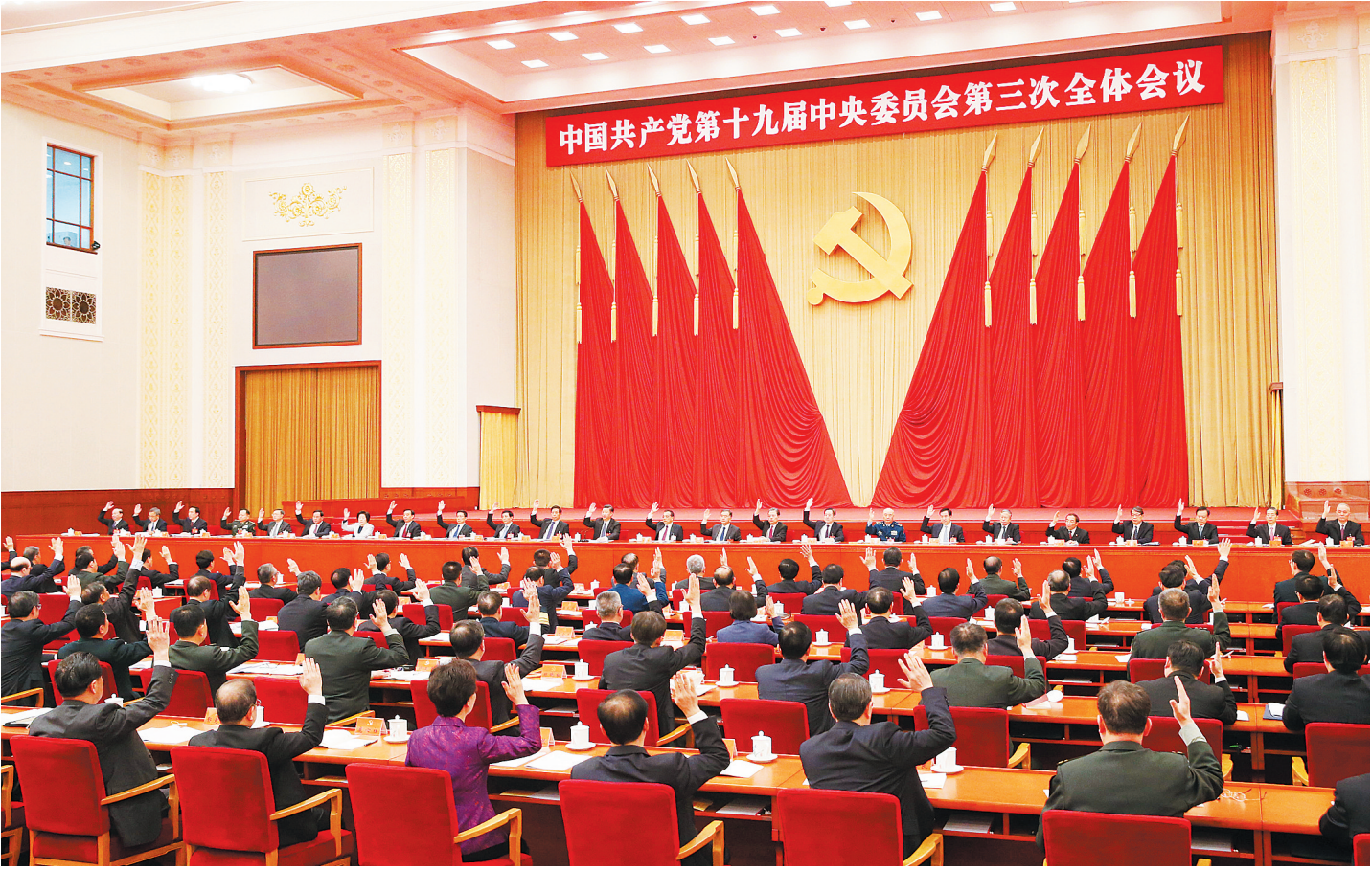
中国共产党第十九届中央委员会第三次全体会议,于2018年2月26日至28日在北京举行。中央政治局主持会议。