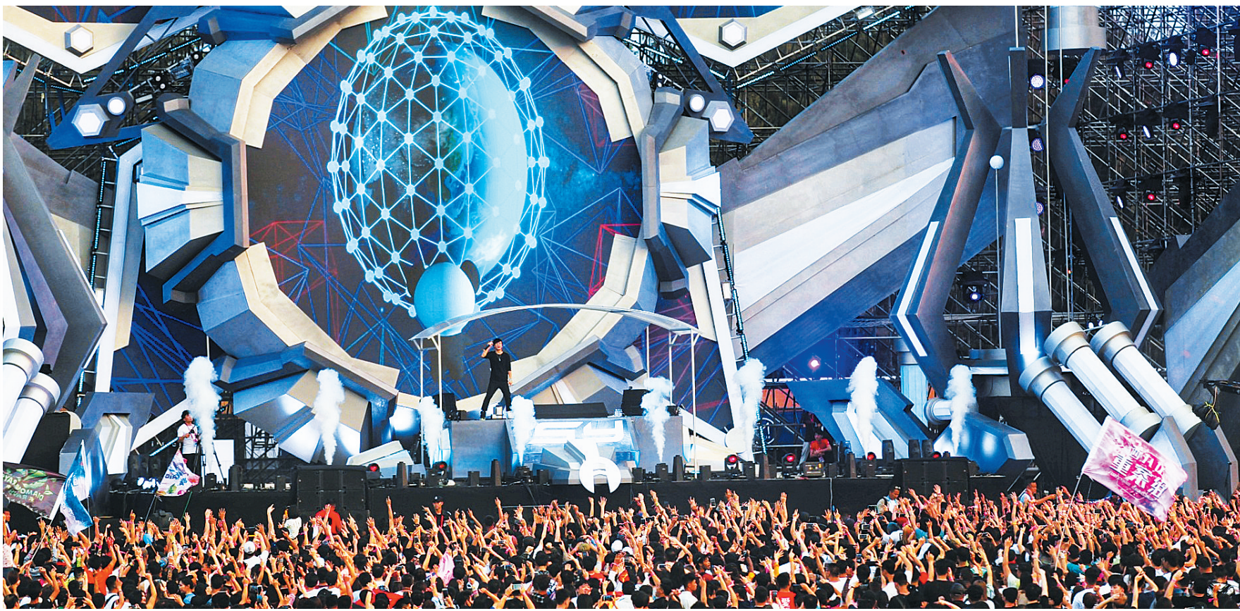
3月2日,三亚国际音乐节海棠湾主会场,电子音乐引爆现场气氛,嗨翻全场。