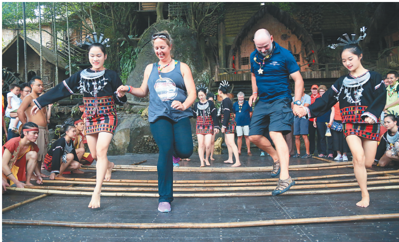
图为克利伯船员在呀诺哒跳打柴舞。