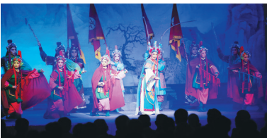
戏迷观看琼剧《护国皇后》喜庆元宵。

一。该剧由许秀菊、何启蛟、杨杰、周杰斌、姚彩虹、姚浪主演，已凭借演员娴熟的演技和优秀的舞台布景、服装设计和灯光制作，在“记得住乡愁”2017年第二届大致坡琼剧文化节琼剧大赛中夺得专业组一等奖。