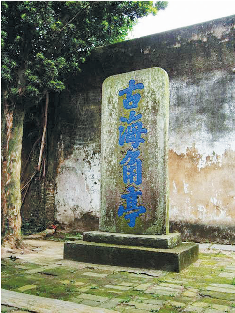
位于广东廉江的『古海角亭』碑刻据称由范梈题写。