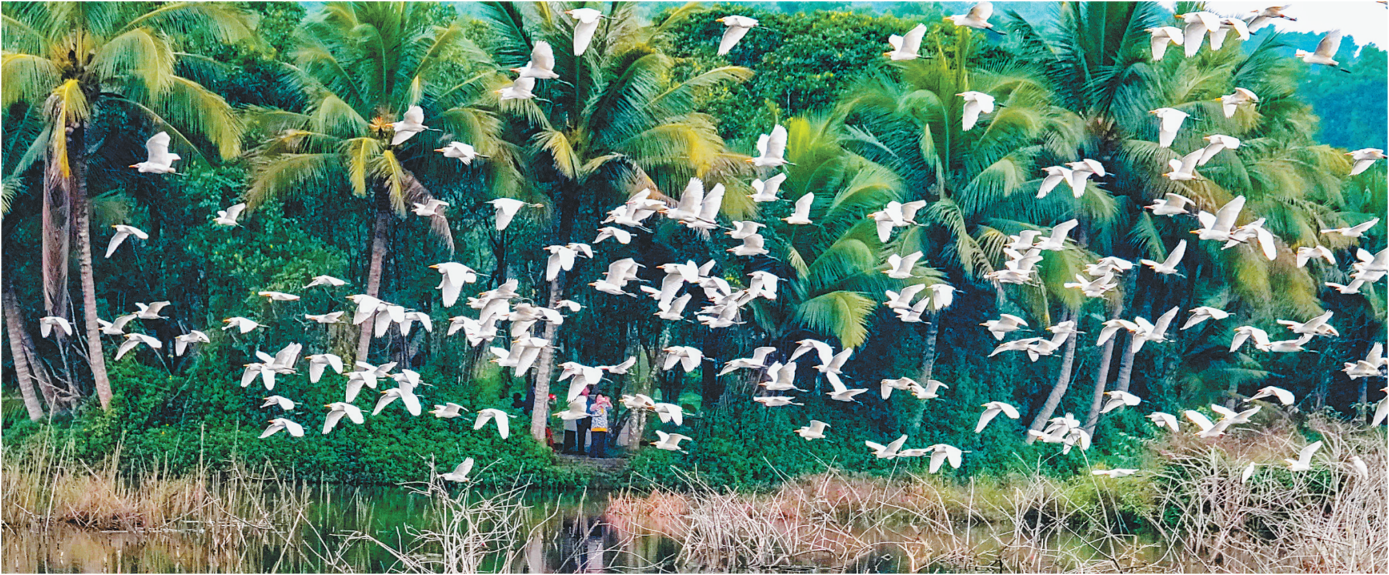
白鹭湖湿地里白鹭翻飞

近日，在琼中黎族苗族自治县湾岭镇的白鹭湖湿地，成群结队的白鹭在湖中自由飞翔、栖息，呈现出一派原生态美景。