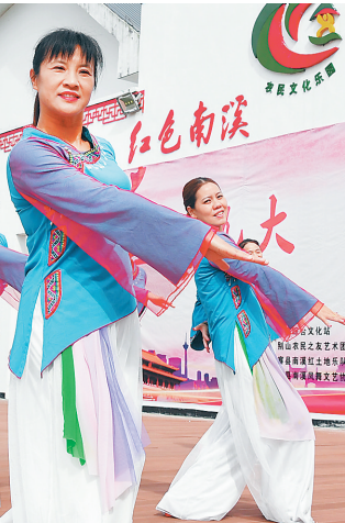
安徽金寨县农民在文化乐园载歌载舞。

党的十八大以来，在以习近平同志为核心的党中央坚强领导下，广大文化工作者坚定文化自信，坚守中华文化立场，坚持以人民为中心的工作导向，推动社会主义核心价值观和中华优秀传统文化广泛弘扬。