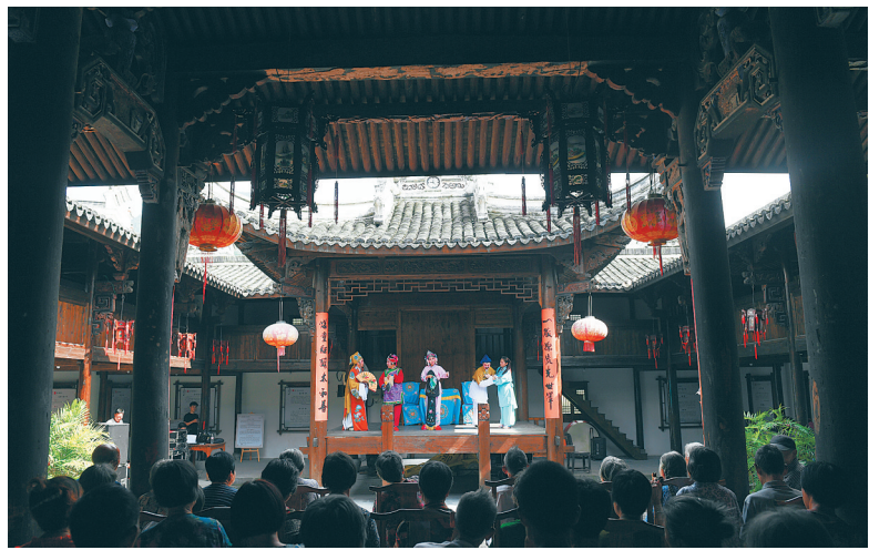
戏曲演员表演越剧《九斤姑娘》。

7天票房57.23亿元，国产片占比99.66%，超过1.4亿人次走进影院——今年春节期间，“史上最强春节档”成为当前文化消费市场蓬勃旺盛的缩影； 推进基层文化资源整合，实现“一站式”服务，全国形成了安徽农民文化乐园、浙江农村文化礼堂、山东文化大院、广西“五个一”村级公共服务中心等各具特点的建设模式；