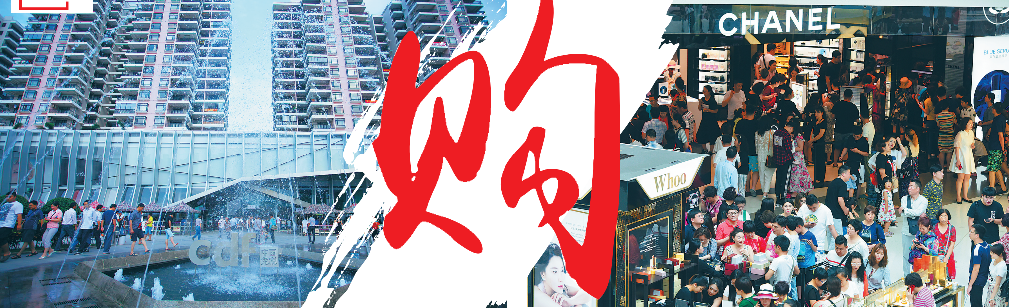
2011年11月24日，位于三亚市区的原三亚免税店吸引许多游客。