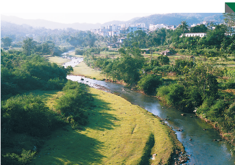
10年前的营根河。（资料图片）