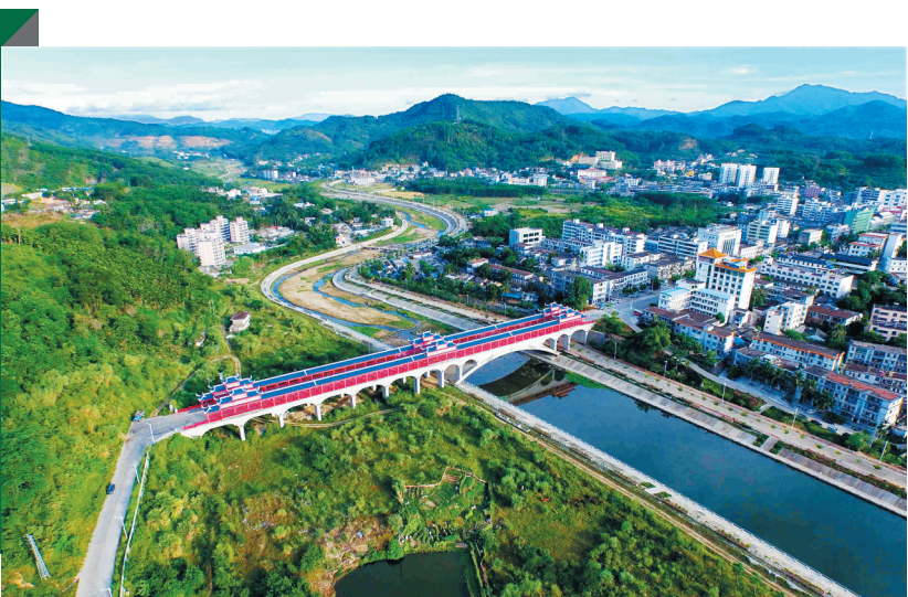
营根河新貌。