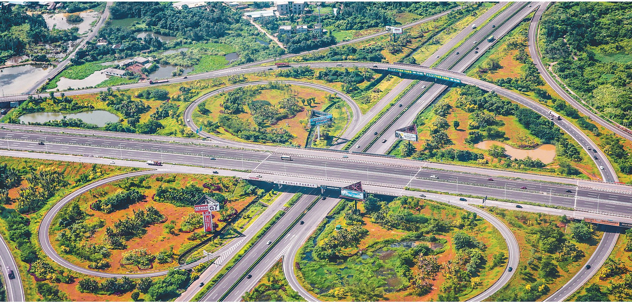
海口东线高速与绕城高速路网，车辆顺畅行驶。在“多规合一”和“交通一盘棋”理念的引领下，我省公路交通建设步伐明显加快，以田字型高速公路为主骨架的路网建设加速推进。