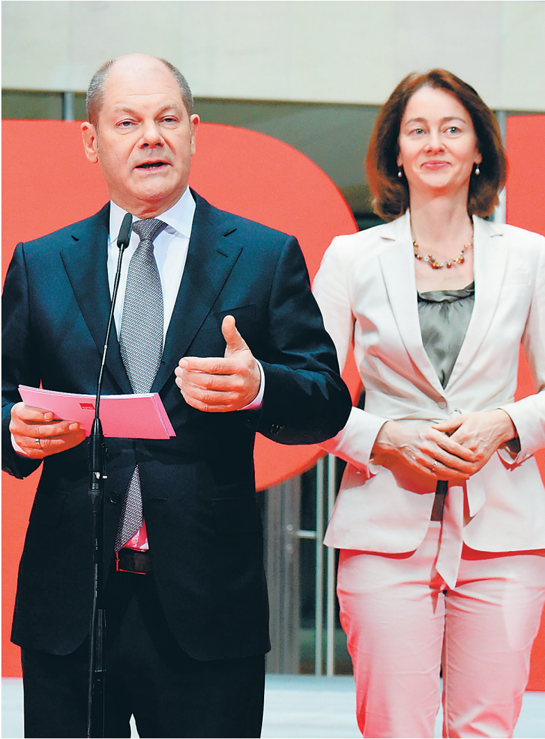
3月9日,现任汉堡市市长、德国社民党主席肖尔茨(左)等出席新闻发布会,肖尔茨将出任新内阁副总理兼财政部长。

按照惯例,默克尔将在定于14日举行的联邦议院全会上当选新一届联邦政府总理,开始她的第四任期,新政府随即正式投入运行,结束去年9月联邦议院选举后迟迟没有组建政府的僵局。 (综合新华社柏林3月10日电)