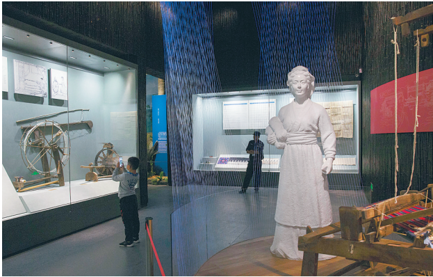
位于五指山市的省民族博物馆近日重新对外开放。