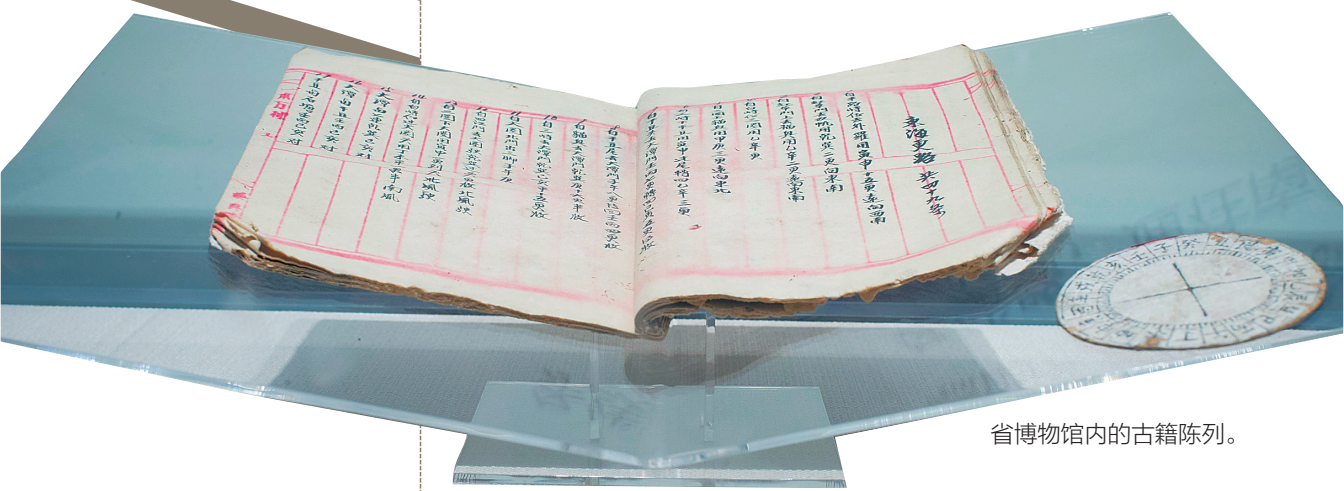
省博物馆内的古籍陈列。