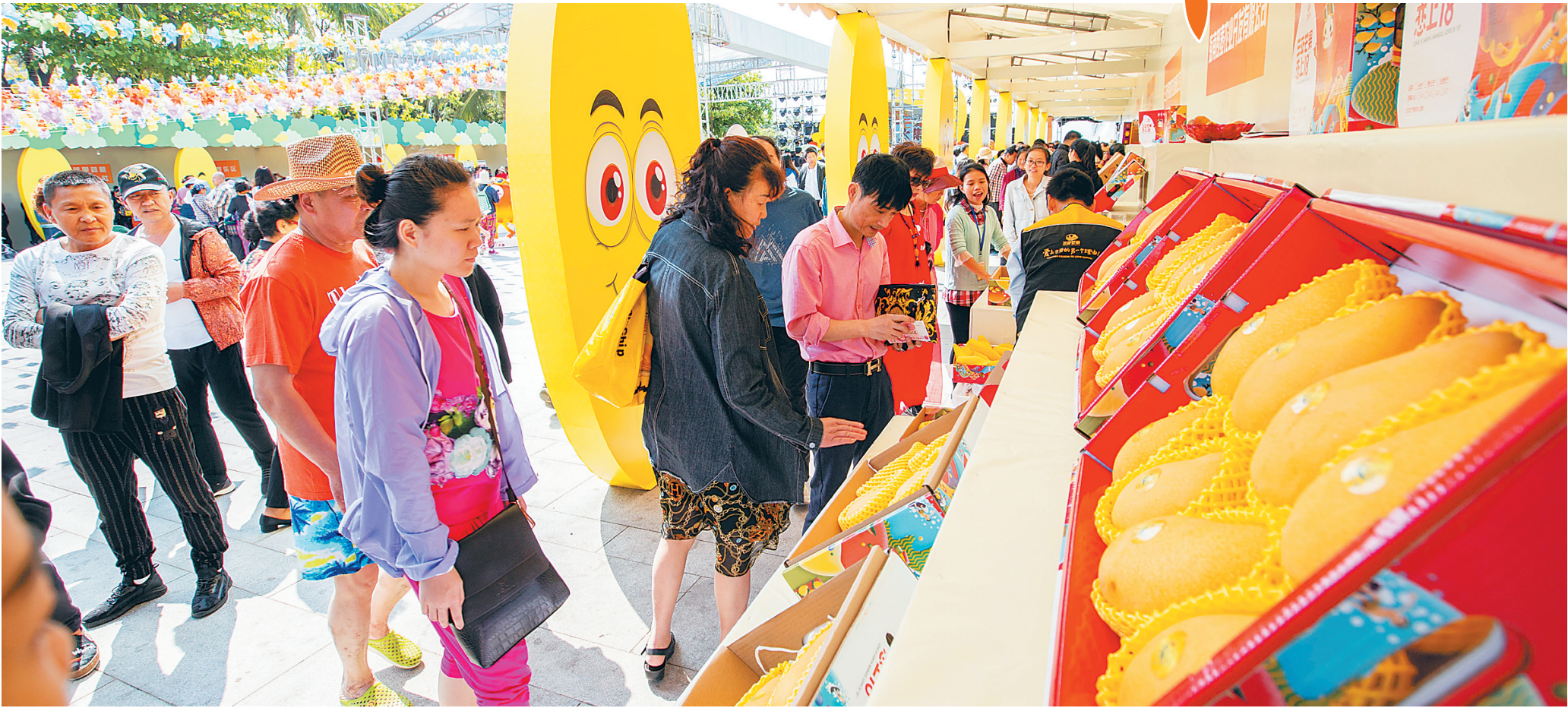
市民游客在三亚大东海广场,三亚芒果大集现场参观、品尝各品种芒果。