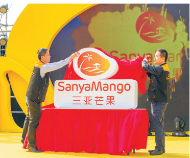
3月10日,三亚芒果大集开幕式上,三亚推出了三亚芒果的视觉识别新LOGO。

三亚市政府相关负责人表示,三亚将努力构建三亚芒果发展的现代产业体系,深入推进品牌发展战略,延长产业链,鼓励芒果衍生产品的开发,将三亚芒果保护好、建设好、发展好,让三亚芒果产业更好地发展。