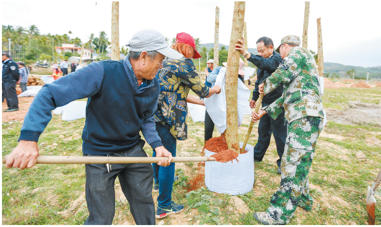
陵水黎族自治县本号镇格泽村集体企业发展苗圃产业,带领村民致富。图为格泽村集体企业首批苗木种植现场。

“许多工商、税务登记、注册、办证的事,村民们都不懂,希望我们代劳。我们确实可以代办,但没这么干,而是坚持带着他们去做,这样他们慢慢就懂这些知识。”应本号镇政府之邀,去年下半年以来,吴佩君带领团队长期驻扎该镇,对村集体企业管理人员即村民们进行现代企业经营知识辅导,培养人才。