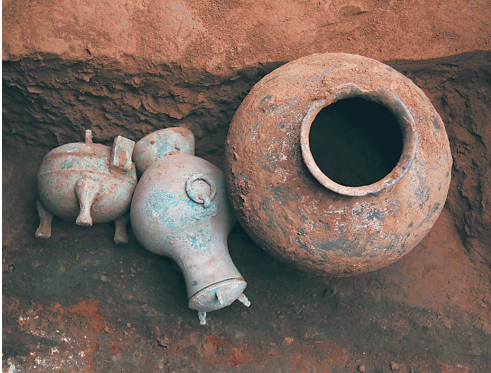
西咸新区空港新城岩村秦人墓葬发掘中发现的盛有古酒的铜壶(中)(资料照片)。

近日，陕西省考古研究院公布了西咸新区空港新城岩村秦人墓葬的发掘结果，其中引人注目的是在一件密封较好的铜壶里，发现了距今 2000 多年的古酒。 新华社发