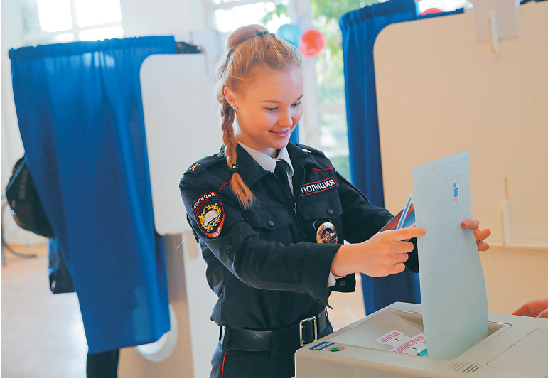
3月18日，在莫斯科一处投票站，一名警察学院学员参加投票。