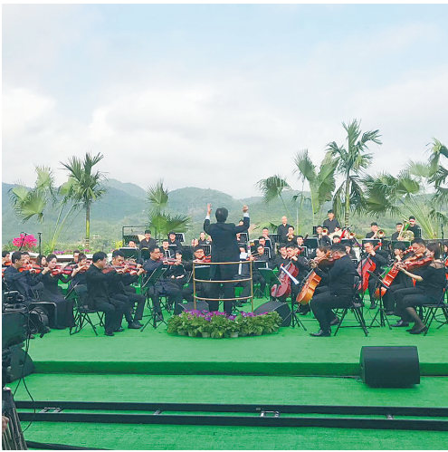
中央电视台音乐频道大型户外实景音乐会节目《四季剧场——2018春季音乐会》录制现场。

本台音乐会将在央视音乐频道择期播出,中央电视台、杭州爱乐乐团等共计200余名工作人员参加节目录制。