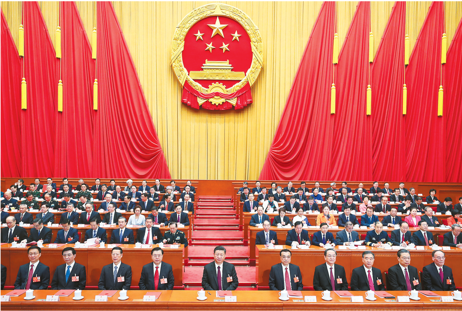
3月20日，第十三届全国人民代表大会第一次会议在北京人民大会堂闭幕。中共中央总书记、国家主席、中央军委主席习近平发表重要讲话。