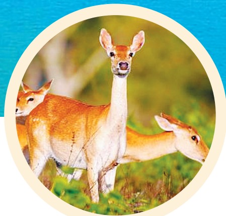
东方大田坡鹿保护区的坡鹿。

此外,东方以新发展理念为引领,发展绿色新型工业。一方面通过大力招商引资,给入驻东方的企业创造更优越的发展环境,加快推进项目建设;另一方面着力提升临港工业发展水平,做强精细化工,支持重点企业进行节能技术改造,实现工业的健康可持续发展。