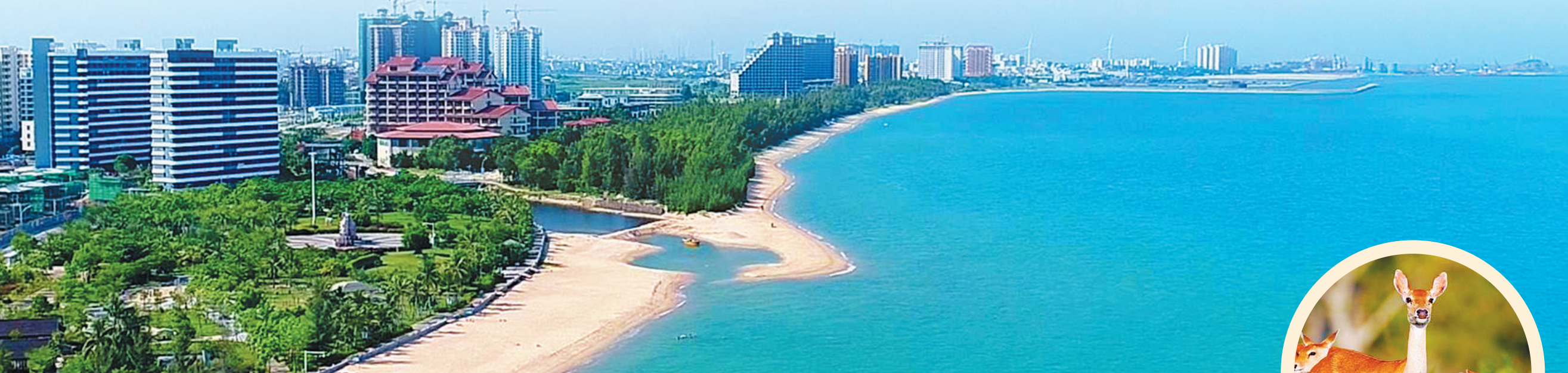
去年以来,东方市大力推动“三创”工作,完善基础设施,打造美丽海岸线,城区面貌焕然一新。