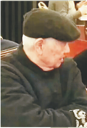
2016年，两岸“桂冠诗人”洛夫在台湾。

读诗、诵诗时，洛夫的音容笑貌，恍若还在。如果一定会在，那一定在他的诗歌里。听上去，倒也是件幸事。图