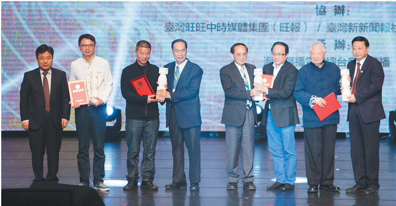
2016两岸诗会“桂冠诗人”颁奖典礼在台湾佛光山举行，洛夫先生（右二）站在领奖台上。

当洛夫听到这一消息后，他欣然接受，很高兴，也很看重。“在我们心中，洛夫先生是享誉海峡两岸、在国际有影响的著名诗人，