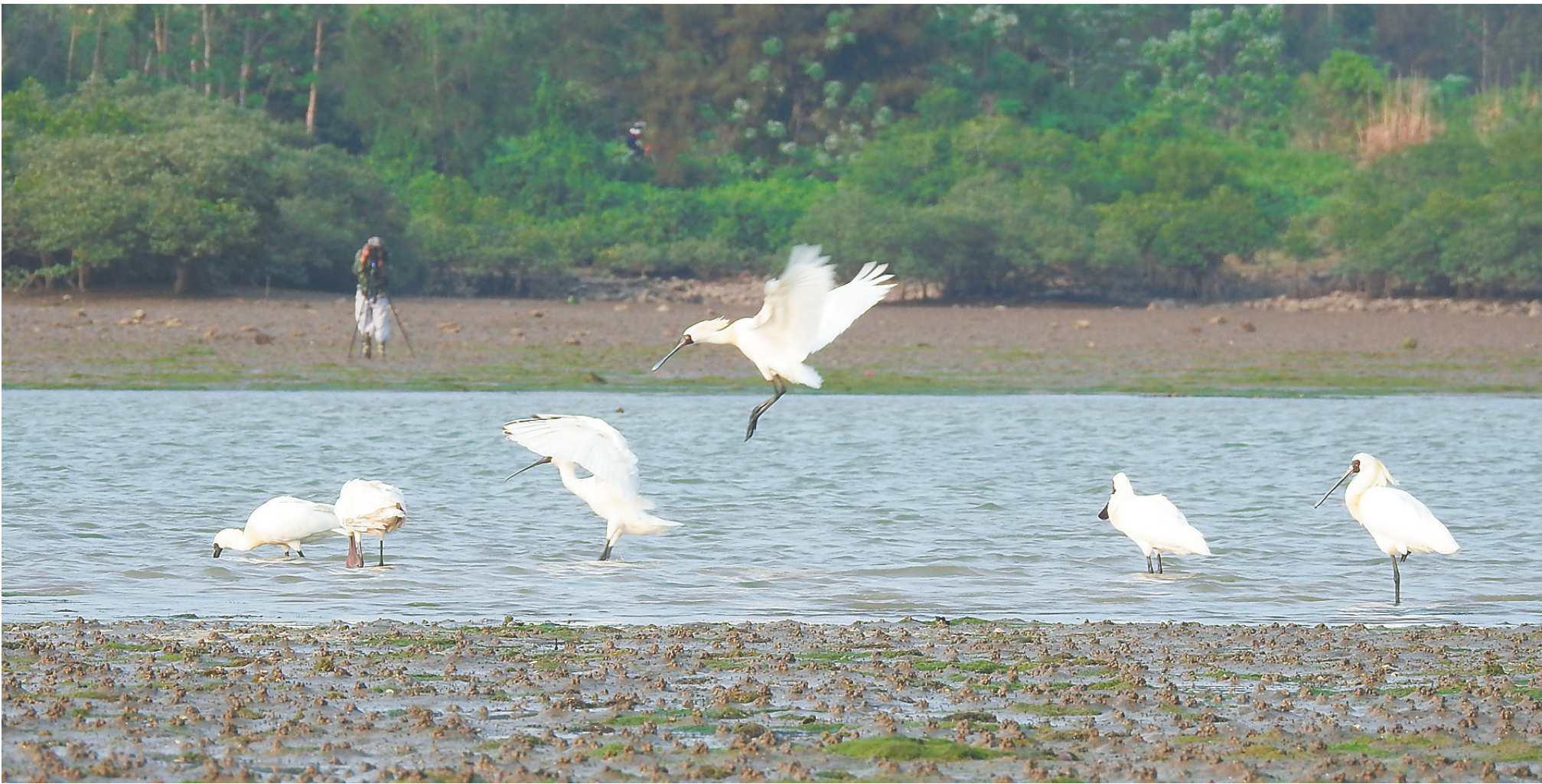
3月24日,在新盈红树林国家湿地公园内嬉戏的黑脸琵鹭。