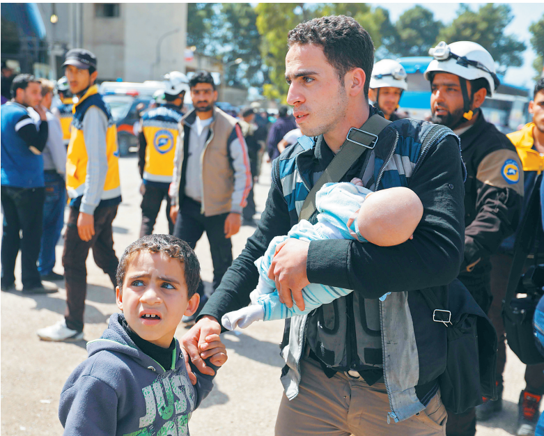
27日,一名从东古塔地区撤离的男子抱着孩子。

“沙姆自由组织”首先撤离,过去一周内从哈赖斯塔镇撤出超过4500名武装人员和平民,“拉赫曼军团”紧随其后,23日开始陆续撤出人员。同时,“拉赫曼军团”按照协议,分批释放超过30名政府军士兵和政府支持者,以换取安全撤离通道。