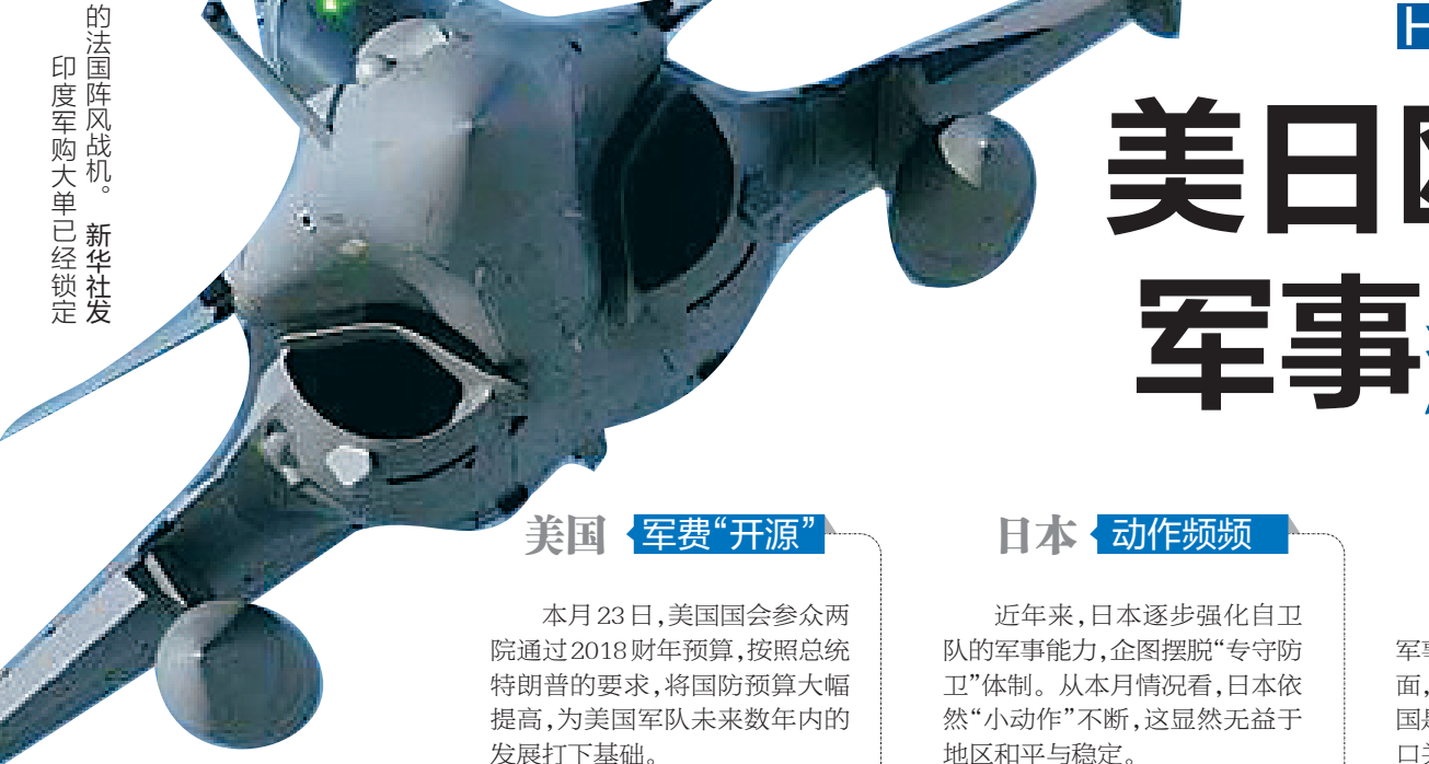
的法国阵风战机。印度军购大单已经锁定