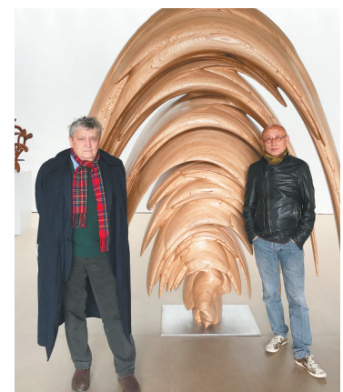
英国策展人诺曼(左)和俞可。

诺曼·罗森塔尔爵士出生于英国剑桥,是一位享誉国际的策展人、艺术史学家,曾任英国皇家艺